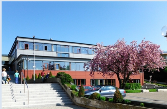
Grundschule Tapfheim Schulstraße 8 86660 Tapfheim